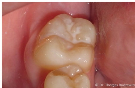
Schutz vor Karies: Versiegelung der feinen Grübchen auf der Kaufläche

Bei der Versiegelung werden die Fissuren mit einem hellen Kunststoff dauerhaft verschlossen, so dass an diesen Stellen keine Karies mehr entstehen kann (siehe Abb. unten).